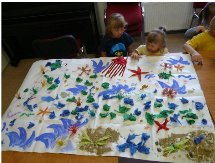
výtvarné tvoření v Březejci - „moře“

Proběhl v srpnu 2010 v Dětském středisku Březejc u Velkého Meziříčí. Pobytu se zúčastnilo 9 rodin. Odborný program tvořila Feuersteinova metoda, ORT, logopedie a služby Sdružení „Piafa ve Vyškově“ (hiporehabilitace, canisterapie, fyzioterapie). Tři asistentky pomáhaly s dětmi a chystaly doprovodný program.